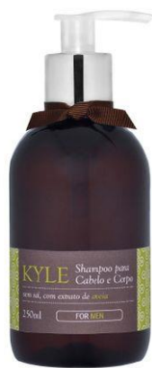
Shampoo para Cabelo e Corpo 250ml