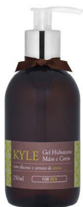
Gel Hidratante Mãos e Corpo 250ml