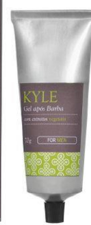
Gel Após Barba 70g