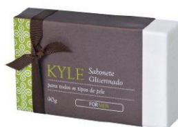
Sabonete Glicerinado 90g