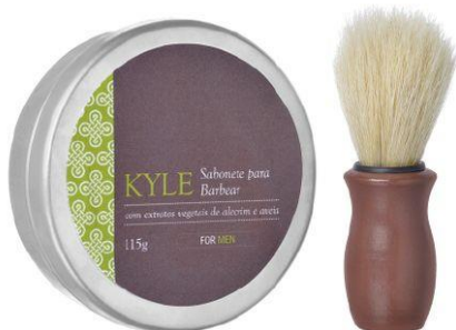
Sabonete para Barbear 115g